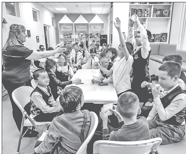
■ На занятиях дети наполнялись необыкновенным писательским энтузиазмом: каждому хотелось поделиться придуманной историей

На встрече «Мечты Афанасия» в ходе увлекательной игры, описанной в книге Джанни Родари «Грамматика фантазий», ребята сочиняли сказку про персонажа произведения М.М. Зельдиной, отвечая на вопросы: «Что могло присниться Афанасию?», «Где он находился и во что мог превратиться?», «Что герой готов был сделать?», «Как отреагировали окружающие?», «Чем всё закончи-