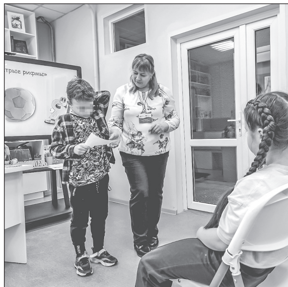
...а потом и сами попрактиковались в рифмовке, после чего презентовали свои стихотворения сверстникам

Для библиотечного расследования, проведённого по книге Н.П. Кончаловской «Дело в шляпе», были подготовлены листы с нарисованными на них головными уборами Робинзона Крузо, Гулливера, Красной Шапочки, Незнайки, барона Мюнхгаузена, доктора Айболита. А в качестве реквизита были представлены шляпки с перьями, бантами, цветами, фруктами, треуголки, цилиндры, шлемы богатырей и космонавтов и даже «волшебная» шапка-невидимка. Дети вытягивали карточки, разложенные рубашкой вверх, переворачивали их и описывали возможного владельца головного убора.