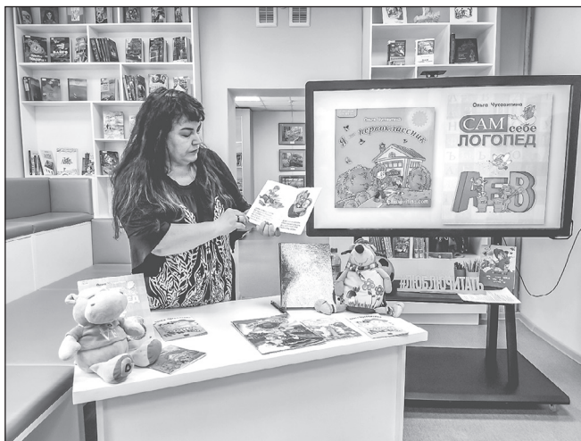
■ От поэтессы О.В. ЧУСОВИТИНОЙ ребята узнали об азах стихосложения...