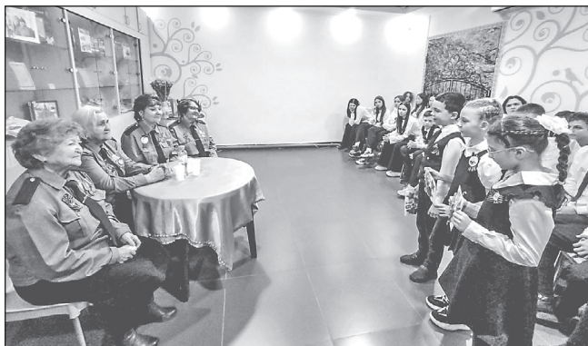
■ По завершении встреч школьники вручают подарки гостям в память о тёплом общении в библиотеке

ников Великой Отечественной, а затем тех, кто сегодня защищает нашу страну. Их имена уже вписаны в историю — некоторые из них присвоены улицам Тюмени.